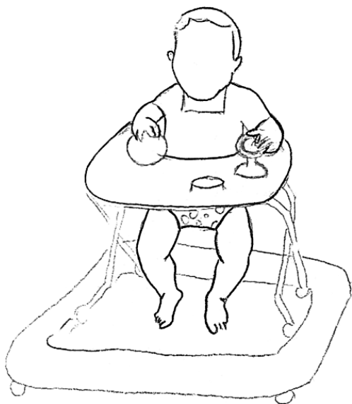
Slika 2. Primjetan obrazac hoda na prstima.