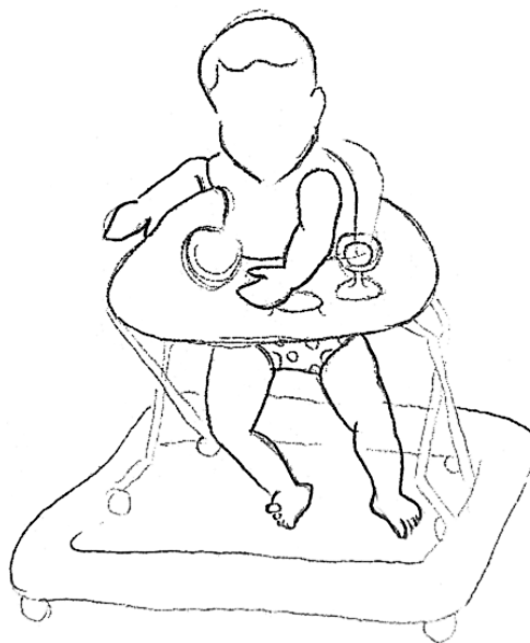
Slika 1. Nagnuti trup djeteta u stranu i prema naprijed, loša kontrola pokreta glave, pokretanje uz izvrnuto stopalo.

Rigidni okvir dječje hodalice djetetu priječi pogled na donje ekstremitete i teren kojim se kreće, a ograničena je i kinestezija (osjet pokreta tijela i dijelova tijela). Uloga kinestetskih informacija temeljna je tijekom razvoja hoda uz prisutnost vizualnih povratnih informacija. Istraživanja su pokazala da su djeca, prilikom inicijalnog prohodavanja, pokazala potrebu kinestetskog istraživanja