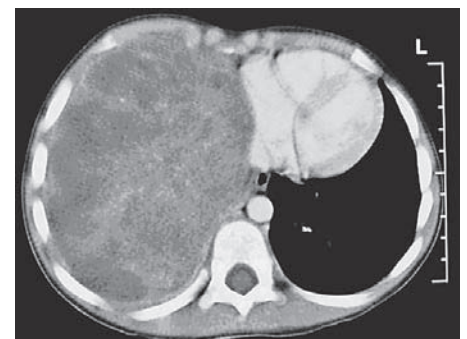
Slika 3. Pleuropulmonalni blastom tip III. CT prsnih organa prikazuje solidnu tvorbu koja ispunjava cijelu desnu polovicu prsništa (strelica).

PPB je genetička bolest. Obiteljsko javljanje s mutacijama gena DICER1 javlja se u 25% bolesnika i udruženo je s renalnim tumorima (31). U članova obitelji češći su germinativni tumori, tumori mozga, tiroidni tumori, limfomi, leukemije, sarkomi i histiocitoza. Histološki se PPB u djece razlikuje od tumora u odraslih po svojoj primitivnoj i embrionalnoj stromi, odsutnosti karcinomatозne komponente i potencijalu sarkomatозne diferencijacije. PPB se dijeli u tri histološka tipa: tip I. - cističan (prosječna dob 10 mjeseci); tip II. - građen od cistične i so-